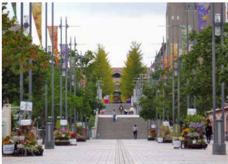
前方に見えるのは首都大学東京