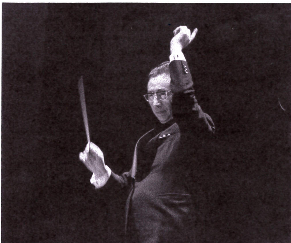
1977年 楽友会 第26回定期演奏会 モーツァルト「レクイエム」を指揮