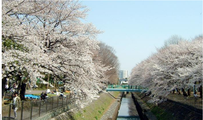
善福寺川緑地公園